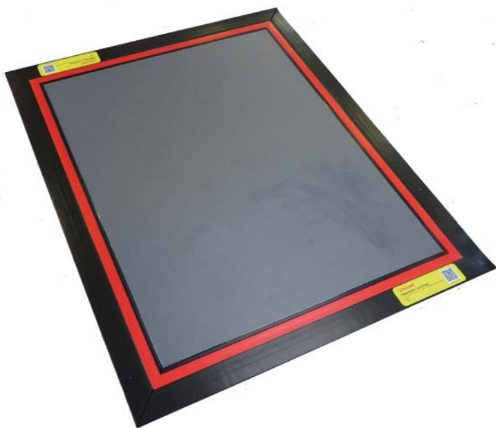
EXEMPLE DE TAPIS AMOVIBLE